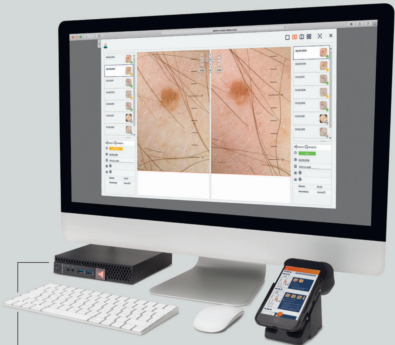
Bild & Daten Management für bis zu 10 mobile, digitale Dermatoskope.

Verwaltet Bilder, spart Zeit und versteckt sich im Schrank.