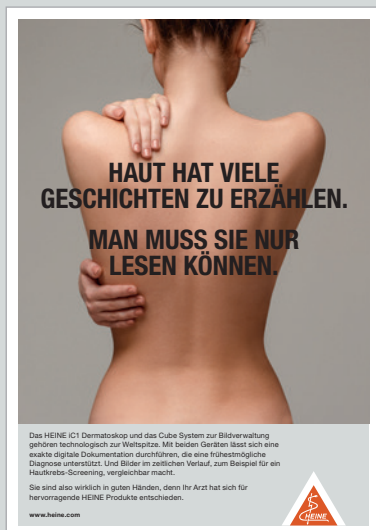
Poster für Ihren Wartebereich

Wenn Sie Material für Ihre Homepage, für Veröffentlichungen oder Veranstaltungen benötigen, nutzen Sie das Paket mit rechtfreien Fotos und Texten, das wir Ihnen gerne zur Verfügung stellen. Weitere Informationen via E-Mail: cube@heine.com