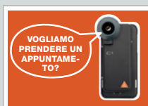
Cartolina per gli appuntamenti