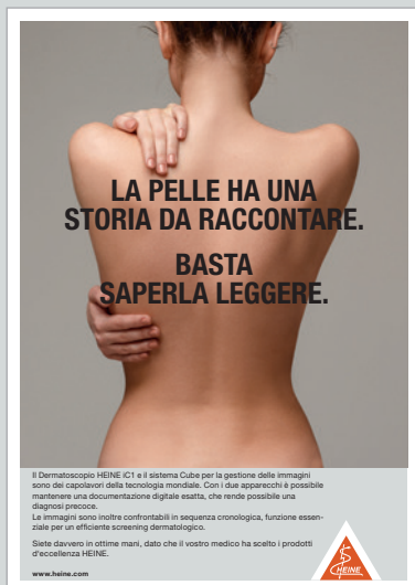
Poster per la vostra sala d'attesa

Se avete bisogno di materiale per il vostro sito web, pubblicazioni o eventi, utilizzate il pacchetto con foto e testi liberi da copyright, che saremo lieti di mettere a vostra disposizione. Se desiderate maggiori informazioni, non esitate a inviare un'e-mail a cube@heine.com .