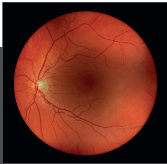
Sicht auf die Retina durch eine Katarakt mit visionBOOST*