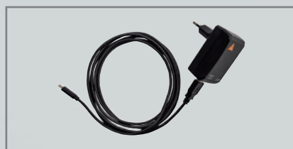
E4-USBC Steckernetzteil mit Kabel [04]