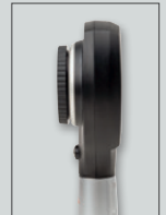
Sin el disco de contacto