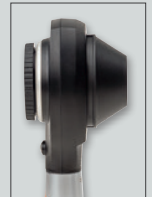
Con el disco de contacto