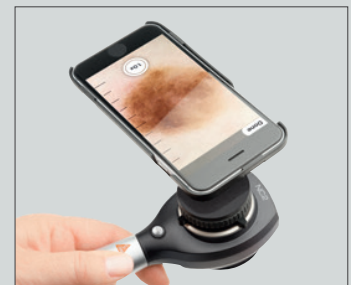
Con funda adaptadora para iPhone