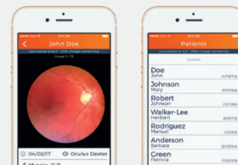
Immagini ad alta risoluzione