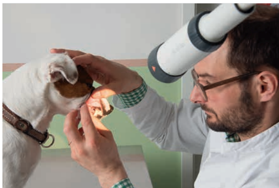
Lampada da visita HEINE EL 10 LED

Le lampade da visita possono essere fissate alla parete, direttamente al tavolo di trattamento o operatorio oppure per ottenere la massima stabilità a uno stativo girevole. Il collo d'oca mobile consente un posizionamento preciso e rapido della fonte di luce, in base alle dimensioni dell'animale da trattare e del campo di esame. In questo modo si evitano facilmente la formazione di ombre indesiderate, nonché l'abbagliamento involontario degli animali e dei loro proprietari. La copertura della lampada non si riscalda in modo che un eventuale contatto non sia sgradevole per il medico né per il paziente. Nella quotidianità spesso stressante della pratica veterinaria è importante una pulizia rapida e semplice delle lampade da visita. Ciò è reso possibile dal robusto alloggiamento chiuso.