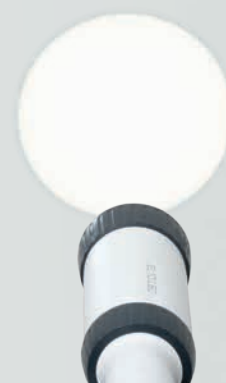
LED HQ : luce di qualità HEINE