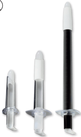
85x20mm 130x20mm 250x20mm