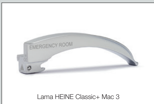
Lama HEINE Classic+ Mac 3

Per i dettagli rivolgetevi al vostro referente o consultate la pagina heine.com